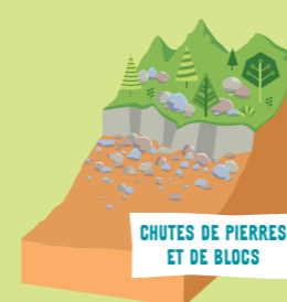
CHUTES DE PIERRES ET DE BLOCS