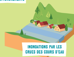
INONDATIONS PAR LES CRUES DES COURS D'EAU