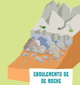
ÉBOULEMENTS DE DE ROCHE