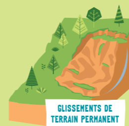
GLISSEMENTS DE TERRAIN PERMANENT