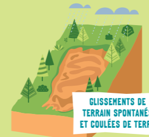
GLISSEMENTS DE TERRAIN SPONTANÉS ET COULÉES DE TERRE