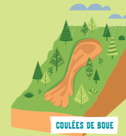
COULÉES DE BOUE