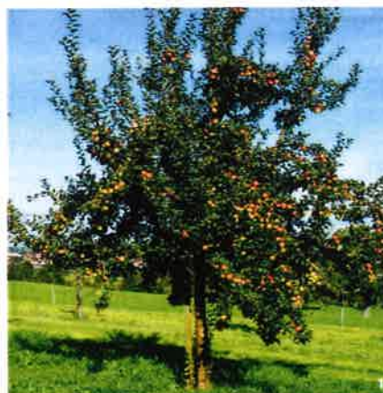
A gauche, verger ; à droite, arbre fruitier haute tige