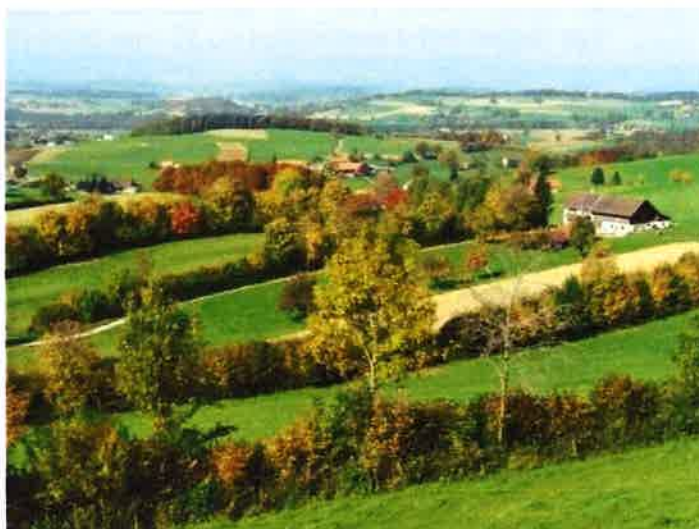
A gauche, allée d'arbres ; à droite, haies