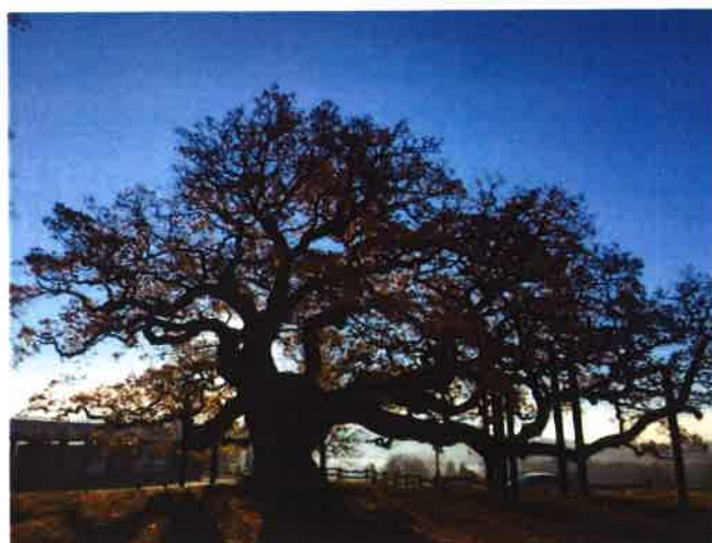
A gauche, arbre isolé ; à droite, arbre remarquable (chêne de Morrens)