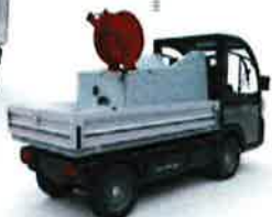
Arrosage Nettoyeur haute pression