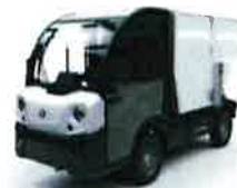
Benne de collecte corbeilles