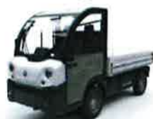
Plateau fixe ou basculant