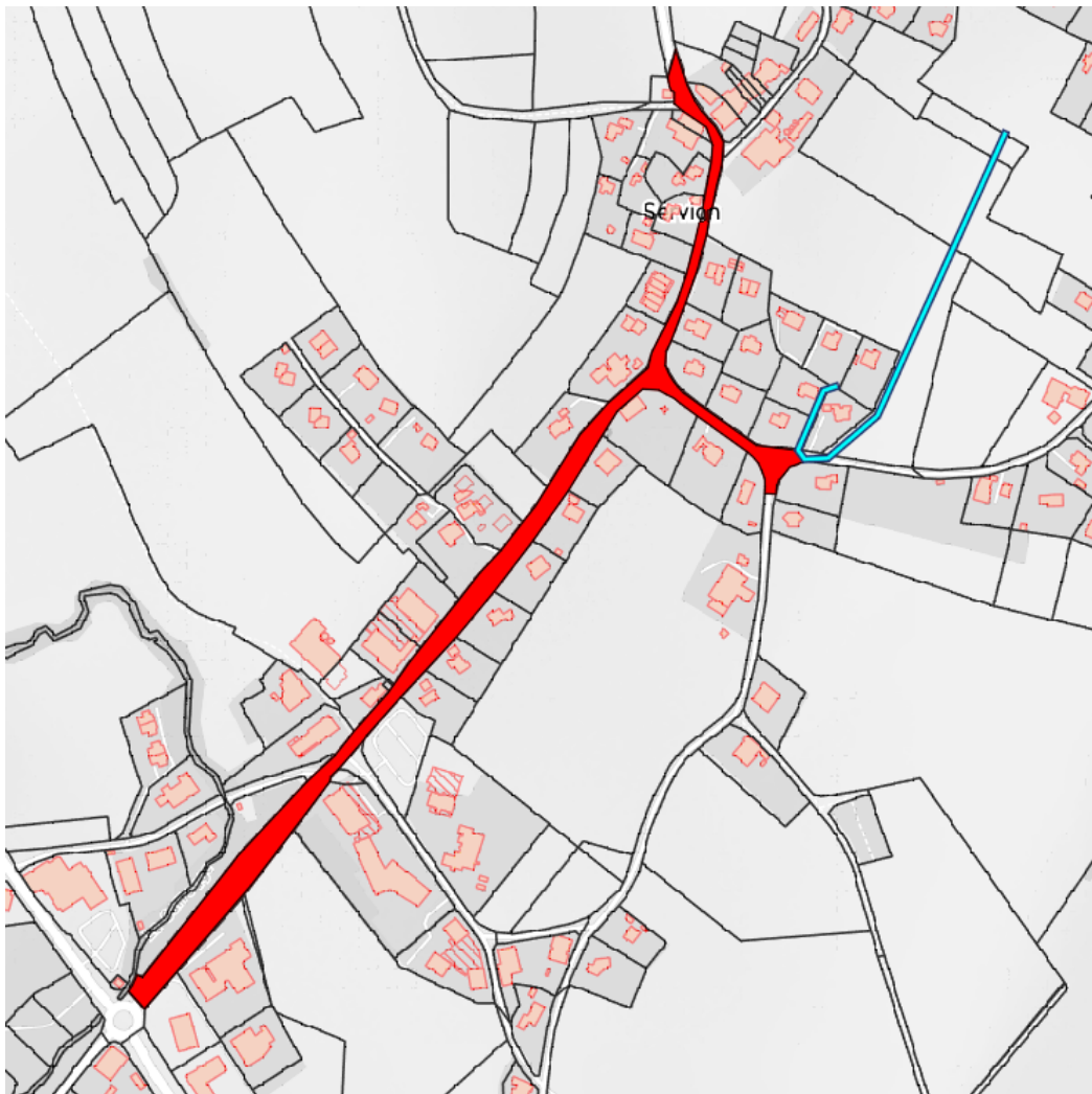
Tronçon de la RC 630 en traversée de localité

La longueur du tronçon de route à étudier est d'environ 1'025 m.