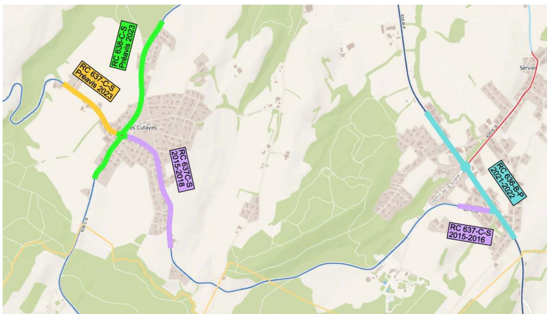
Illustration 1 : plan des routes cantonales en traversée des localités de Servion et de Les Cullayes

Ces travaux d'entretien ont restitué une nouvelle durée de vie aux revêtements et rétabli un bon niveau de sécurité et de confort aux usagers. Ils ont pu bénéficier de subventions conséquentes du Canton.