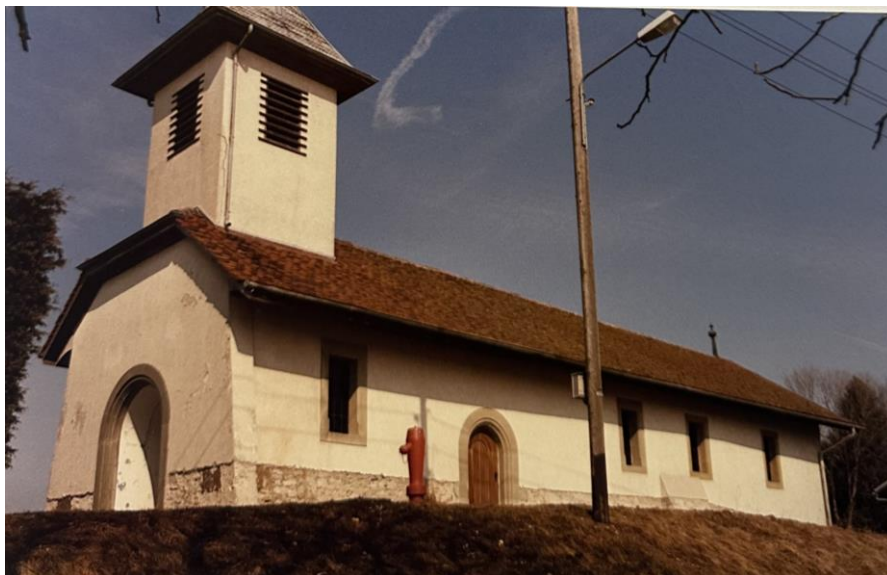
Illustration 3 : Photo 1953 Archives cantonales