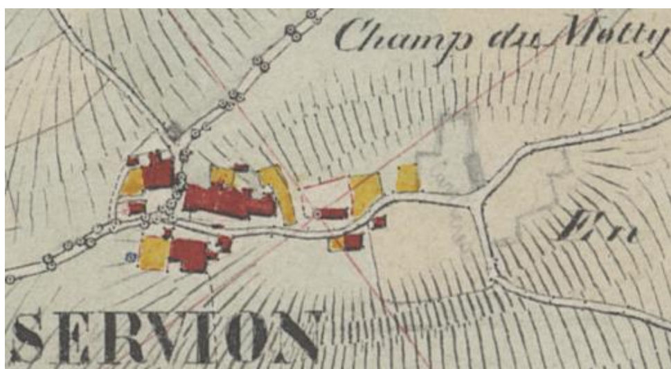
Illustration 1 : Extrait de la carte de Servion en 1870