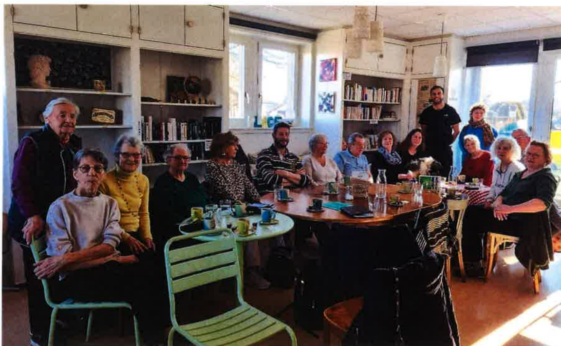
Le groupe habitants à la permanence café

Ces exemples sont révélateurs d'un groupe accueillant, solidaire et motivé, dont les membres portent de magnifiques valeurs, et laissent présager un avenir radieux pour l'association Groupe habitants du Jorat !